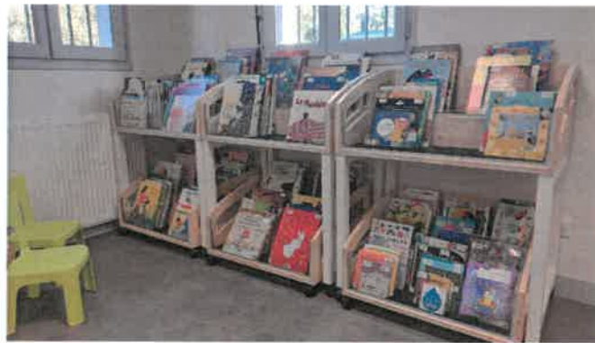
Le coin des petits