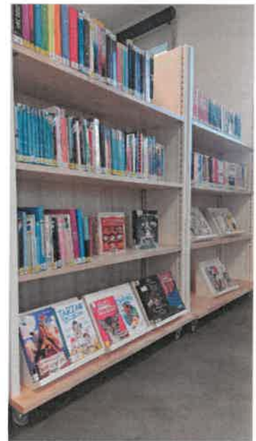
Le coin des ados